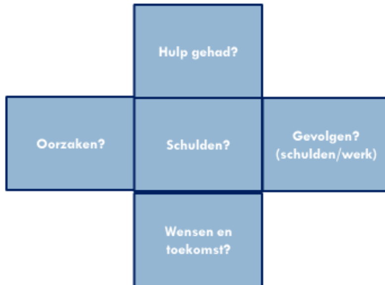
Figuur 2 Praatplaat gebruikt tijdens de interviews

De ontwikkelde praatplaat is vooraf bij drie respondenten (twee werkenden en één werkzoekende) getest op effectiviteit. De conclusie op basis van die drie interviews was dat de praatplaat de beoogde informatie op kan leveren.