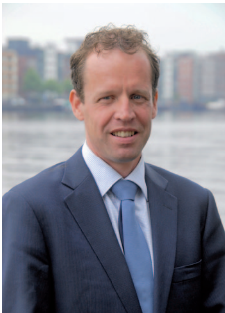
Auteur: drs. Olaf Simonse, Projectleider Wijzer in geldzaken

Ligt hier een taak voor het onderwijs? De visie hierop vertoont in de loop van de tijd een golfbeweging. Er was een tijd dat elk maatschappelijk probleem door het onderwijs moest worden